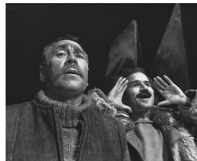
Фото проекта «Школа театрального зрителя»

Театр как Место в городе – не антипод театра Дома, не конкурент репертуарному театру, он не несёт угрозы сложившимся отношениям сцены и зала, традициям. Все это разные лики Живого по Пьеру Бруку театра, вполне способные мирно сосуществовать в пределах одного коллектива. Кроме того, проектные инициативы и стратегии не способны компенсировать художественную неполноценность спектаклей. Совсем не странно, впрочем, что именно те-