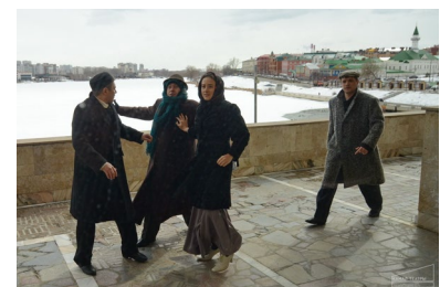
Фото проекта «Будить сердца людей...»

https://kamalteatr.ru/tat/about-the-theatre/repertoire/d-rse-gyybr-tter-teatr-budit-serdtsa-lyudey-teatralnoe-p/#gallery1-3