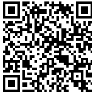
Проект «Молодёжный вторник»

Три молодых режиссёра. Один уже опытный. Двое других делают первые шаги в профессии. В пятницу во вторник вечером... 22 и 29 октября 2019 года. Далее каждый месяц. Эпическая премьера трех спектаклей. Табуированные темы. Остросоциальные диалоги. Повод поспорить и подумать. Высказать восторги и претензии. Три спектакля в двух антрактах с прологом и эпилогом. В антрактах – шедевры национальной кухни, дизайн-маркет, музыка и танцы, стихи и дискуссии. Театр Камала открывает новую страницу своей истории. Мы всегда были рады молодым в наших стенах. Но это нечто особенное. В 1968 году бунтующая молодёжь захватила Авиньонский фестиваль. Прогнала Жана-Луи Барро, довела до инфаркта Жана Вилара,